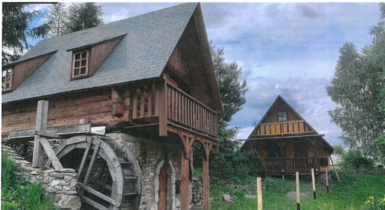
Dolina Starego Młyna