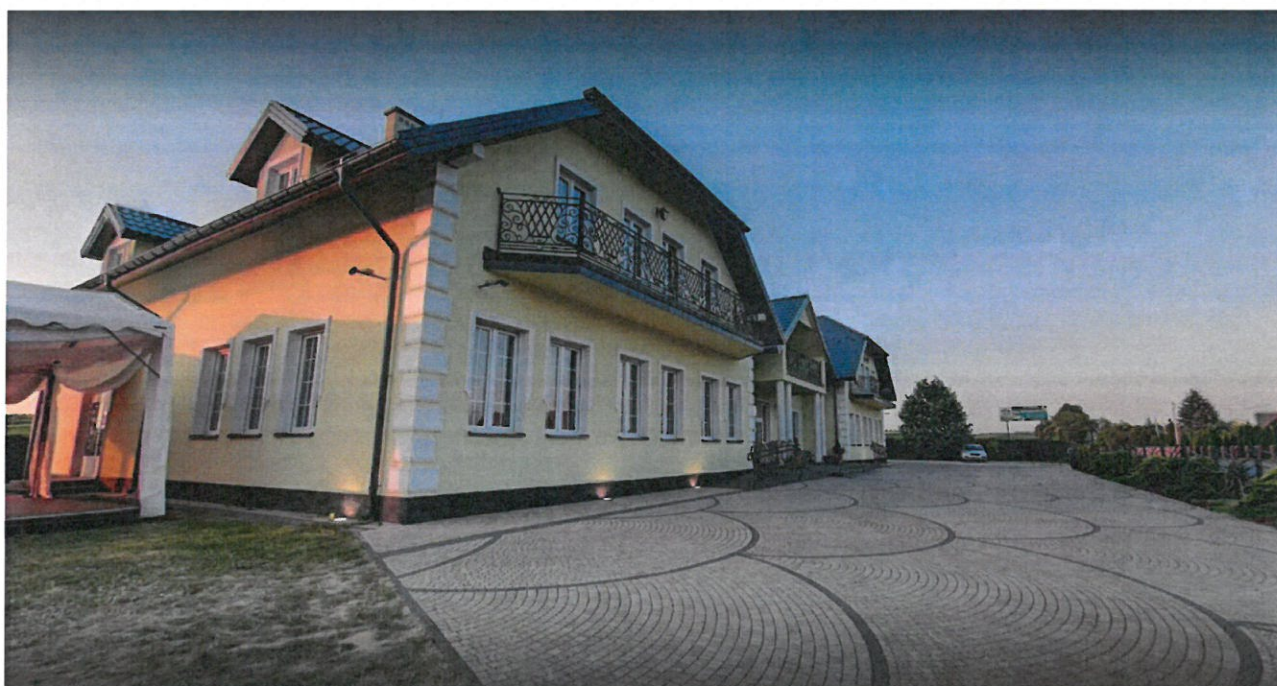
Dom Bankietowy Magnolia