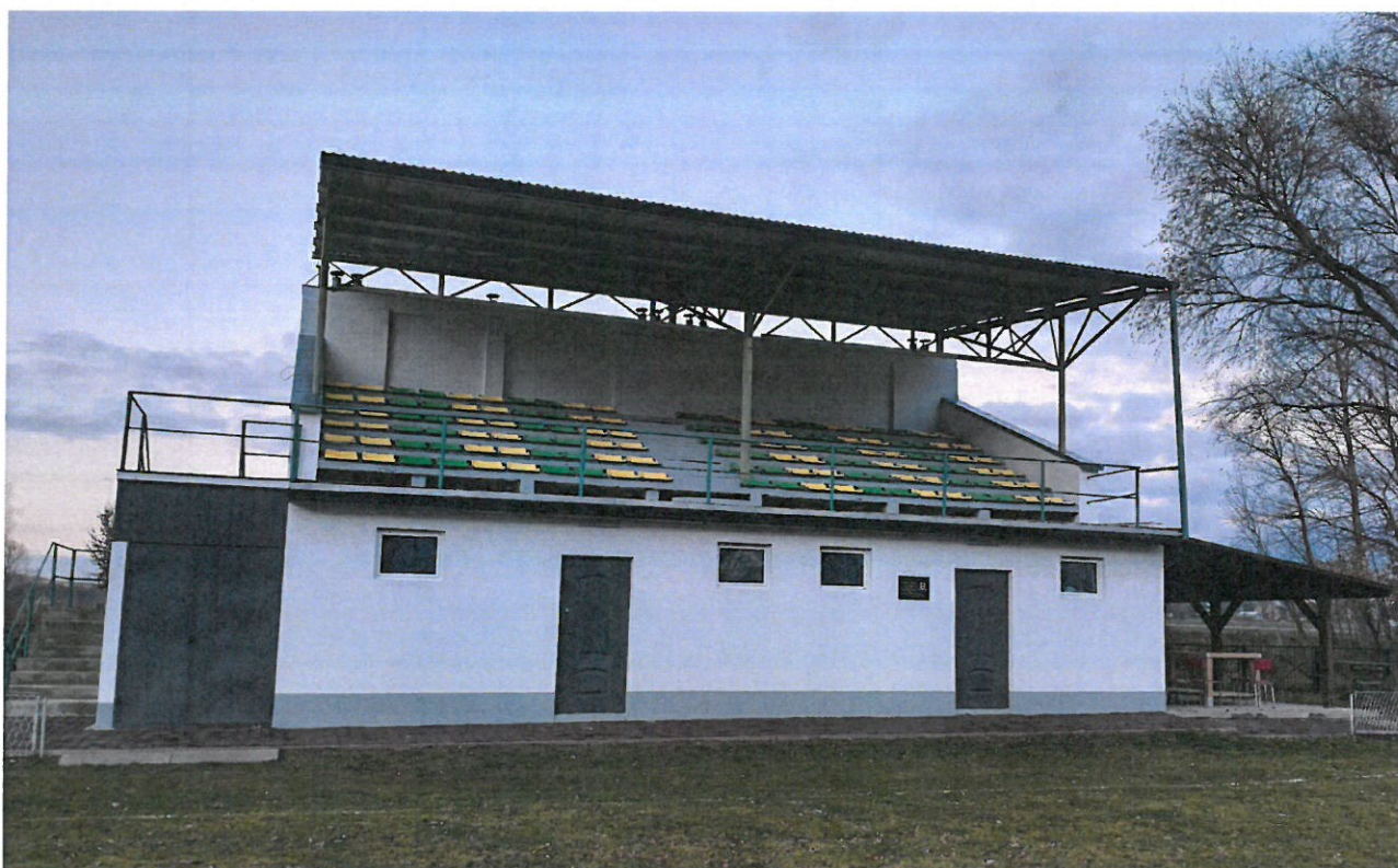
Budynek Klubu Sportowego