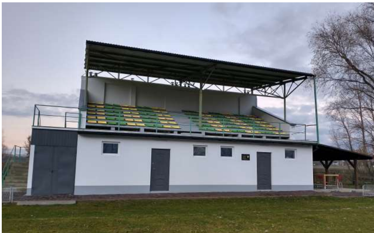
Budynek Klubu Sportowego