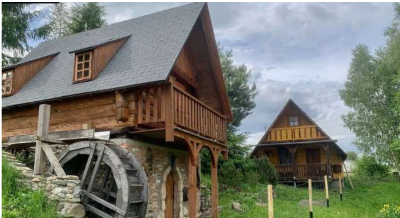
Dolina Starego Młyna