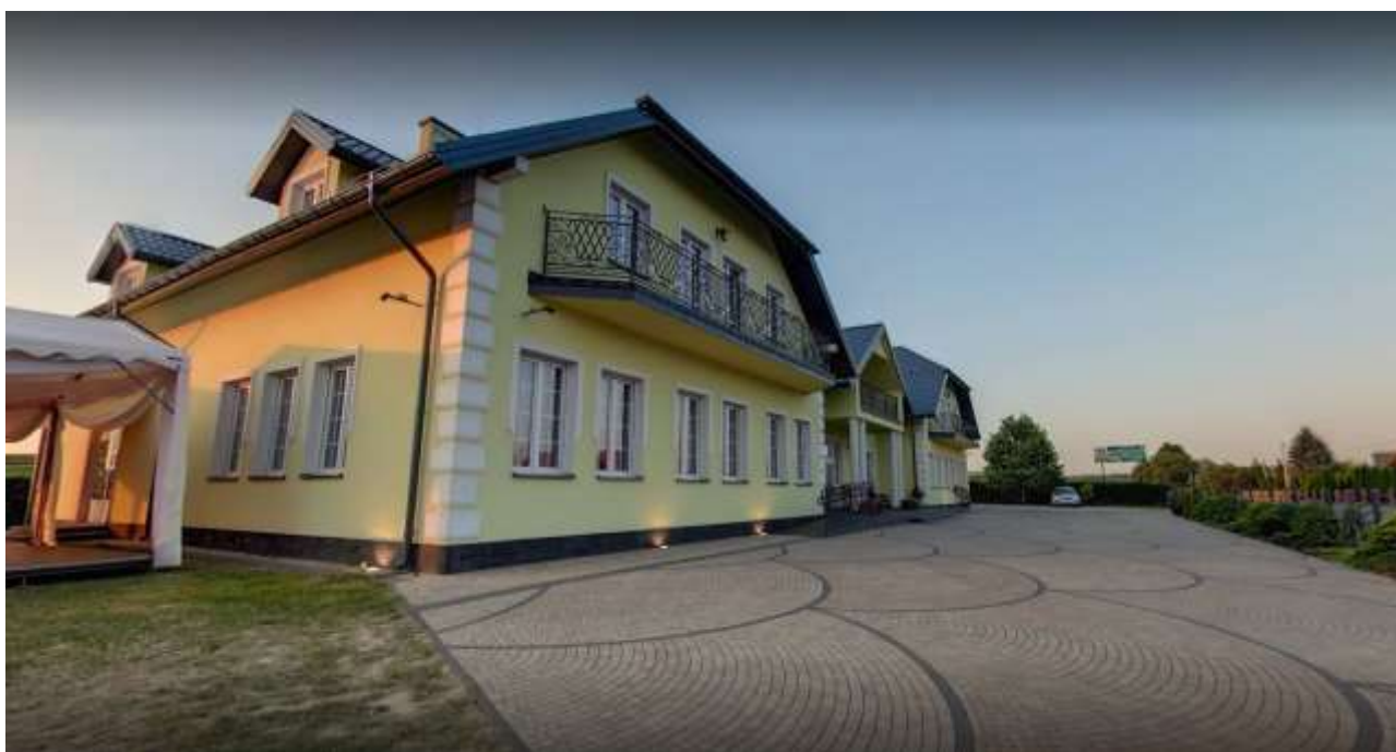
Dom Bankietowy Magnolia