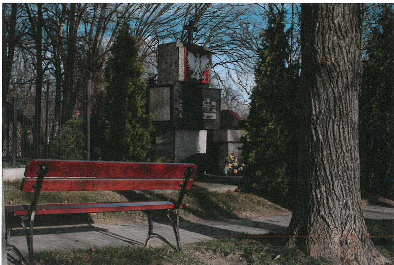
Obelisk poświęcony ofiarom pacyfikacji wsi Zalesie w czasie II wojny światowej