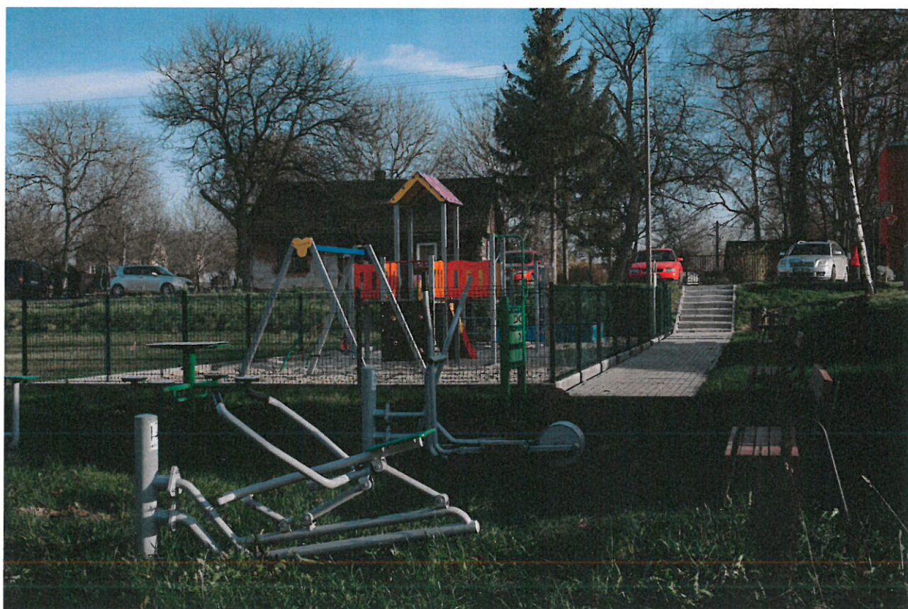
Plac zabaw z siłownią zewnętrzną