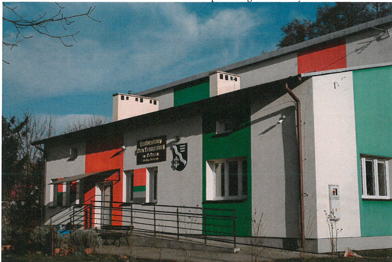
Środowiskowy Dom Samopomocy w Zalesiu