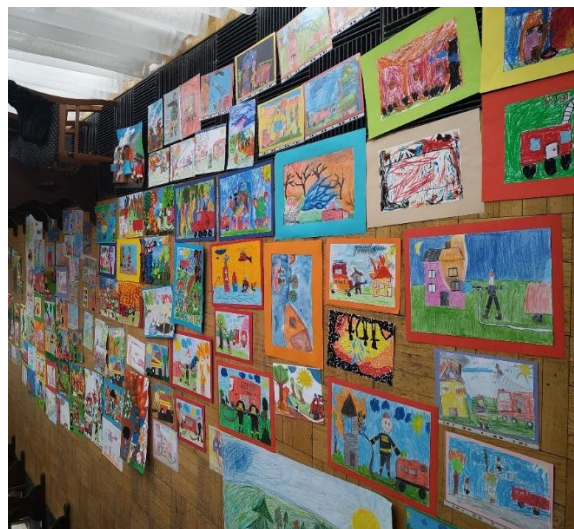
Galeria prac konkursowych