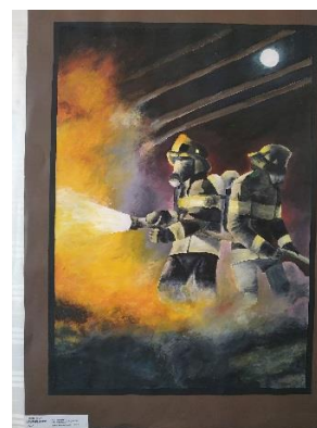
Jedna z nagrodzonych prac

Dziękujemy wszystkim za tak liczny udział w tegorocznej edycji konkursu młodym i trochę starszym artystom, a opiekunom gratulujemy zaangażowania w rozpropagowanie konkursu w swoim środowisku.