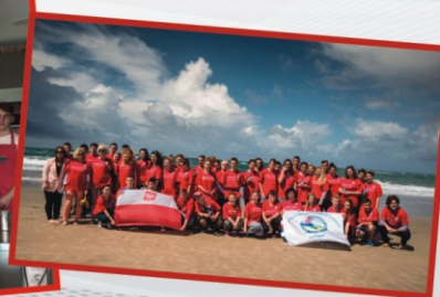
Staż w Portugalii