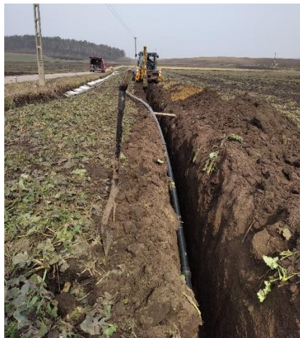
Rozbudowa sieci wodociągowej

W miejscowości Maćkówka przysiółek „Potok” trwa rozbudowa sieci wodociągowej na odcinku 600 mb. Niebawem rozpocznie się rozbudowa sieci wodociągowych i kanalizacji sanitarnej przy drogach dojazdowych ulicy Widokowej w Zarzeczcu.