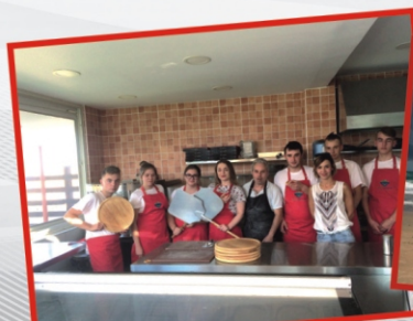
Staż w Grecji