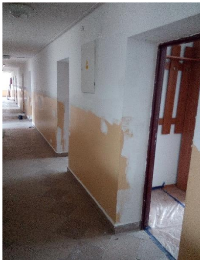
Remont pomieszczeń w Internacie

Sukcesywnie realizowane są remonty budynków komunalnych, przy wykonawstwie pracowników gospodarczych Urzędu Gminy oraz uczestników Centrum Integracji Społecznej. Obecnie trwa kapitalny remont II piętra w budynku Internatu Zespołu Szkół im. W. Witosa oraz remont sali dużej w remizie OSP w Kisielowie.