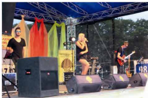
Występ gwiazdy wieczoru Jagody i Brylanta