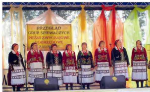
Występ Zespołu Śpiewaczego z Kisielowa

Po występach odbył się koncert zespołu „Jagoda i Brylant”, a następnie zespół muzyczny „The Five” prowadził zabawę taneczną. Dziękujemy wszystkim, którzy zorganizowali XX Jubileuszowy Festyn pod Platanem i zapraszamy za rok.