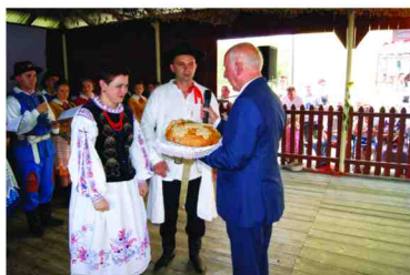
Starostowie przekazują symboliczny bochen chleba