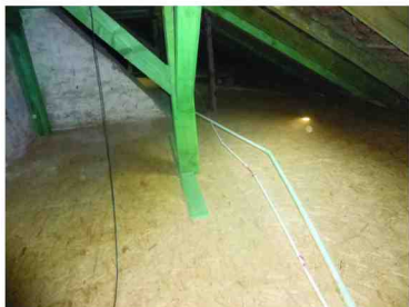
Wymienione elementy konstrukcji pałacowego dachu