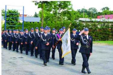
Uroczysty przegląd pododdziałów