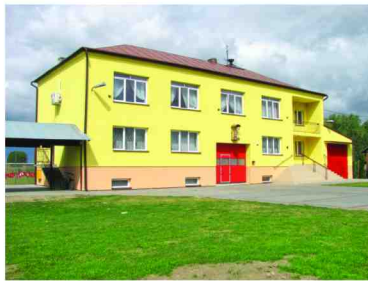
Odnowiona remiza w Żurawiczkach

W sierpniu zakończono roboty termomodernizacyjne i remontowe w budynku remizy OSP w Żurawiczkach. Wykonano elewację budynku z dociepleniem na pow. 600 m 2 wraz z chodnikami i płytą odbojową z kostki brukowej. Pomieszczenia remizy wyposażono w klimatyzatory. Wartość zakupionych materiałów do remontu wyniosła 40 tys. zł. w tym kwotę 10 tys. zł stanowi dotacja od Marszałka Województwa Podkarpackiego w ramach „Podkarpackiego Programu Odnowy Wsi”. Ponadto koszt montażu klimatyzacji wyniósł 15.500 zł. Wykonawcą robót budowlanych była brigada remontowo-budowlana Urzędu Gminy Zarzece.