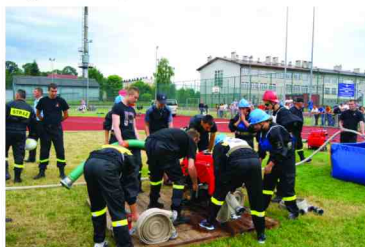
OSP Zarzece w trakcie zawodów