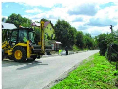
Budowa chodnika w Żurawiczkach

W celu poprawy bezpieczeństwa dla ruchu pieszkiego wykonano chodnik przy drodze powiatowej w Zalesiu. Obecnie trwa budowa chodnika przy drodze powiatowej w Żurawiczkach (przez wieś) i przy Ośrodku Zdrowia w Zarzeczcu. Roboty wykonuje Powiatowy Zarząd Dróg w Przeworsku.