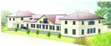
Wizualizacja budynku starej szkoły

Przebudowę i zmiany sposobu użytkownika zaplanowano w budynku Starej Szkoły w Zarzeczcu, zlokalizowanej w centrum miejscowości. Obecnie trawają prace projektowe, które zmieniają przeznaczenie budynku na centrum kulturalne z biblioteką i siedzibami jednostek pomocniczych Urzędu Gminy.