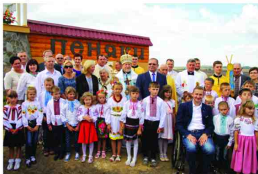
Pamiętkowe zdjęcie z Pieniak