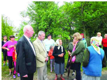
W trakcie spotkania z mieszkańcami Pieniak

Po części oficjalnej nasza delegacja udała się do małej wioski Pieniaki, gdzie onegdaj stał pałac Dzieduszyckich. Tutaj bardzo ciepło przywitani nas mieszkańcy, którzy licznie wyszli na spotkanie pod małym kościółkiem, który to sami w miarę swoich małych możliwości remontują i próbują przywrócić do wyglądu sprzed lat.