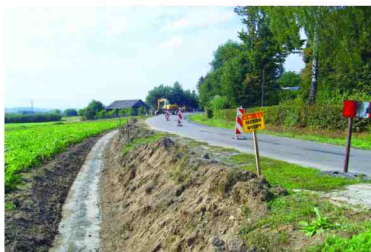
Przebudowa drogi w Kiselowie

Przebudowa drogi powiatowej Kańczuga - Jarosław na odcinku Zarzeccze – Cieszacin Wielki to jedna z najważniejszych inwestycji w bieżącym roku. Wykonawcą zadania została firma SKANSKA, która w wyniku przetargu nieograniczonego spośród czterech wykonawców zaoferowała najniższą cenę w wysokości 1.743 tys. zł. Inwestycja jest dofinansowana kwotą 871 tys. zł. przez Wojewodę Podkarpackiego w ramach Narodowego Programu Przebudowy Dróg Lokalnych. W zakres zadania wchodzi przebudowa przepustu skrzynkowego na początku odcinka drogi w Zarzeczcu, poszerzenie jezdni o 0,5 m na całym odcinku, budowa chodnika szer. 1,5m na odcinku 1320 metrów wraz z odwodnieniem, przebudowęjazdów, budowa murów oporowych w technologii koszy gabionowych oraz wykonanie nawierzchni asfaltowo-bitumicznej o łącznej warstw gr. 9cm i pow. 15.300 m 2 . Długość odcinka przebudowanej drogi wyniesie 2,53 km.