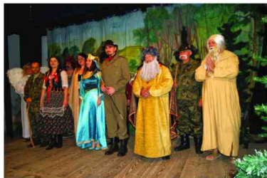
Aktorzy sztuki „Igraszki z diabłem”