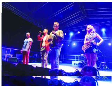
Gwiazda wieczoru – zespół MIG

Organizatorzy zadbali również o oprawę artystyczną w wykonaniu zaproszonych gości. Jako pierwsza – zaprezentowała się Kapela Podwórkowa „BEKA” z Przeworska. Gwiazdą wieczoru był zespół „MIG”, na koncercie którego zgromadzeni widzowie wypełnili niemal cały park. Niedzielne święto zakończono zabawą taneczną z zespołem Family Power.