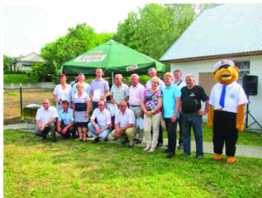
Uczestnicy festynu w Siennowie

w budynku zaś ulokowano wystawę ptaków egzotycznych.