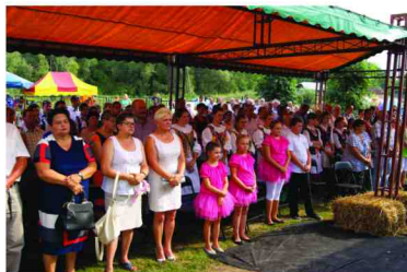
Licznie zgromadzeni uczestnicy dożynek

Zgodnie z tradycją widzowie mogli posłuchać przyspiewek, obejrzeć i podziwiać tańce ludowe, tańce współczesne, wiersze i piosenki przygotowane przez dzieci i młodzież z Żurawiczek pod okiem pracowników Centrum Kultury w Zarzeczcu. Impreza trwała do późnych godzin nocnych, a czas zabawy tanecznej umilał zespół Fair Play.