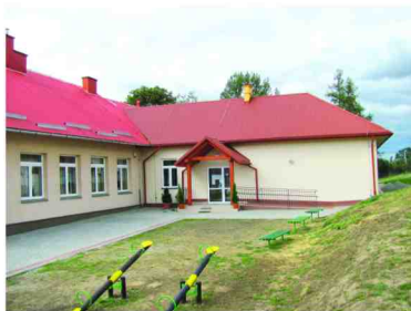
Nowa sala gimnastyczna w Maćkówce