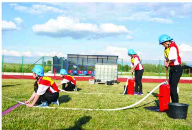
Jedna z drużyn w trakcie bojuówki