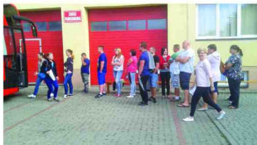
Kolejka przy krwiobusie

Wszyscy Krwiodawcy poza satysfakcją (która w tym przypadku jest największą nagrodą), otrzymali po 9 czekolad, soczek oraz czerwony parasol, a ich krew została szczegółowo przebadana. Ci którzy po raz pierwszy przekazali ten drogocenny dar otrzymali także książeczkę Honorowego Dawcy Krwi.