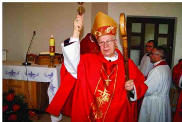
Akt poświęcenia nowej kaplicy

W dniu 19 czerwca 2015 r. odbyło się uroczyste poświęcenie kaplicy cmentarnej w Zarzeczcu, którego dokonał J.E. Ksiądz Arcybiskup Józef Michalik, Metropolita Przemyski.