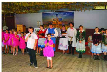
Występy dzieci szkolnych

Organizatorami uroczystości byli: Komitet Organizacyjny Gminnego Święta Plonów oraz Wójt Gminy Zarzeczce. Organizatorzy dziękują wszystkim, którzy przyczynili się, aby to święto rolników wyszło pięknie i okazałe.