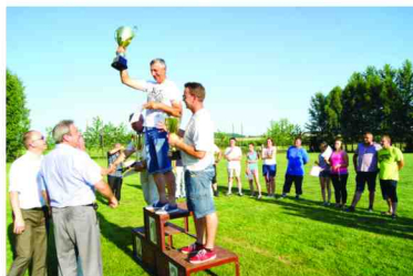
Wręczenie nagród zwycięzcom

W ramach Święta Sportu tradycyjnie rozegrano dwa mecze półfinałowe i finał rozgrywek w piłce nożnej o Puchar Wójta Gminy Zarzeczce, turniej piłki siatkowej o Puchar Przewodniczącego Rady Gminy Zarzeczce, odbyły się także liczne dyscypliny lekkoatletyczne dla chętnych mieszkańców gminy oraz wielobój sołtysów.