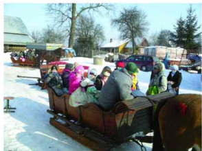
Kulig zorganizowany dla dzieci

uczniowie brali udział w konkursach sportowych, piosenki, w tańcach, grali w gry planszowe a dla tych, którzy nie mają komputerów odbywały się zajęcia w pracowni komputerowej. W okresie ferii zimowych członkowie Stowarzyszenia w ramach wolontariatu (4 osoby) przez okres jednego tygodnia prowadziły zajęcia w trzech grupach.