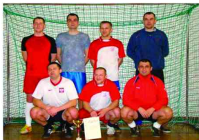
Drużyna DOMEKO – zwycięży turnieju

W dniach 11 i 12 lutego 2012 r. w hali sportowej Gminnego Ośrodka Sportu i Rekreacji w Zarzeczcu odbył się Turniej Piłki Nożnej Halowej o Puchar Wójta Gminy Zarzeczce.