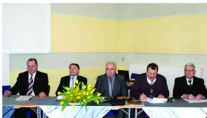
Prezydium Konferencji w Boguchwale