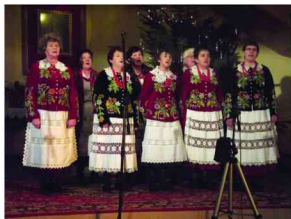
Zespół Śpiewaczy z Kisielowa