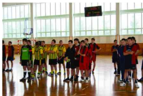
Zbiórka zawodników turnieju

Ministranci i lektorzy rywalizowali w duchu sportowej walki fair play. Gratulujemy zwycięskim drużynom z Przeworska i Mirocina. Ministranci i lektorzy z tych parafii będą reprezentować Dekanat Przeworsk II w rozgrywkach na szczeblu Archidiecezjalnym łańcuckiego - zawody odbędą się w marcu.