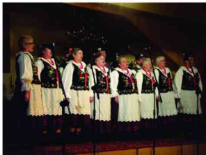
Zespół Śpiewaczy z Roźniatowa