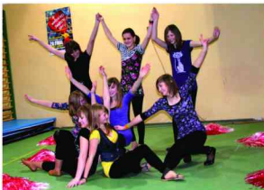
Występ Kosmowaków z ZS w Żurawiczkach

Wszyscy artyści – amatorzy pięknie zaprezentowali swoje umiejętności, czym podbili serca widzów zgromadzonych w sali gimnastycznej Zespołu Szkół Rolniczych w Zarzeczcu.