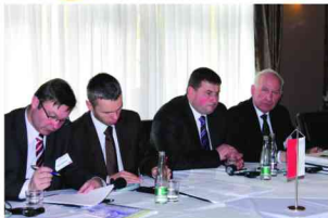
Delegacja Krajowej Rady Izb Rolniczych w Nitrze

Ustalenie wspólnego stanowiska w ramach Grupy Wyszehradzkiej będzie skutkowało jako przeciwwaga w stosunku do często rozbieżnych interesów państw „starej Unii”.