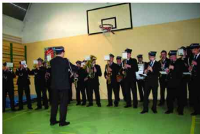
Występ Gminnej Strażackiej Orkiestry Dętej

Piętnastu wolontariuszy zbierało do puszek pieniądze w szkołach, w zakładach pracy oraz w dniu 6 stycznia podczas koncertu charytatywnego.