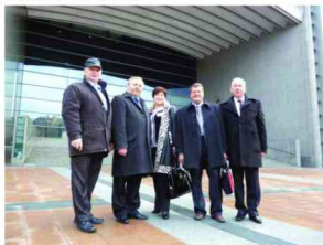
Pamiątkowe zdjęcie przed gmachem Parlamentu

tylko w Brukseli, ale również w poszczególnych krajach członkowskich na szczeblu organizacji rolniczych, rządów i parlamentów.