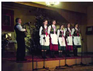
Zespół Śpiewaczy z Łapajówki