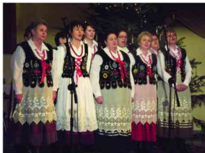
Zespół Śpiewaczy z Maćkówki