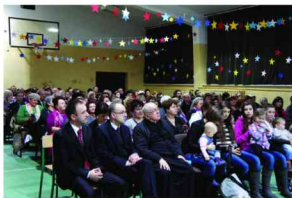
Licznie zgromadzona publiczność na koncercie