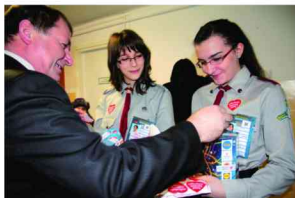
Kwista w trakcie koncertu charytatywnego