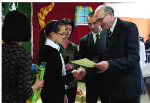
Wracanie nagród zwycięzcom