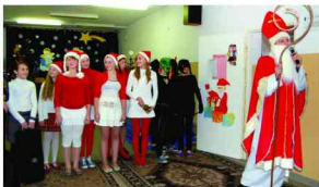
Wizyta Świętego Mikołaja

Kiedy emocje sięgnęły zenitu, na salę wkroczył najbardziej oczekiwany tego dnia Gość, Święty Mikołaj, w barwnym korowodzie Śnieżynek i Diabełków. Wśród pisków i okrzyków radości najmłodszych dzieci, przy pomocy współpracowników, ofiarował swoje prezenty.