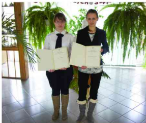
Nagrodzone uczennice ZSR w Zarzeczcu

Stypendium Prezesa Rady Ministrów jest przyznawane uczniowi każdej szkoły ponadgimnazjalnej, który uzyskał najwyższą średnią ocen w szkole.