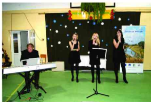
Występ zespołu „PROJEKT K3”

W Przeglądzie wzięło udział 115 uczestników.