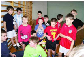
Przygotowanie do rozgrywek

Uczniowie mieli możliwość aktywnego odpoczynku, tak by drugie półrocze roku szkolnego było dla nich jak najlepsze i to pod każdym względem!!!