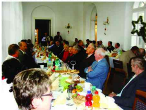
Wspólne kołędowanie na spotkaniu opłatkowym

Impreza została zorganizowana przez Gminny Ośrodek Pomocy Społecznej w Zarzeczcu przy współpracy z Centrum Kultury w Zarzeczcu.