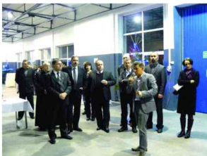
Otwarcie nowego zakładu w Roźniatowie

W ten sposób firma REPLAS wpisuje się w rosące społeczne zapotrzebowanie na skuteczną walkę z przybywającymi stertami śmieci, szczególnie tych, które jak plastik czy guma nie ulegają samoistnej bio-degradacji i pozostawione na wysypiskach śmieci trwać tam będą jeszcze przez setki lat. Dla wszystkich gmin uruchamiających na swoim terenie zbiórkę i segregację tych z jednej strony uciążliwych śmieci z drugiej zaś cennych surowców wtórnych firma REPLAS będzie naturalnym partnerem i sprzymierzeńcem w walce o „świat bez śmieci”.