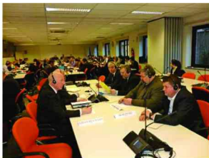
Polska delegacja w trakcie obrad

Zebrani na posiedzeniu przedstawiciele państw członkowskich biorąc pod uwagę, że świat potrzebuje coraz większej produkcji żywności oraz rentowności gospodarstw rolnych negatywnie zaopiniowali zamiar wprowadzania „zazielenienia” a głównie odłogowania ziemi.