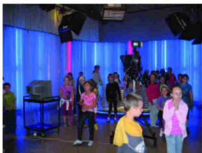
Zwiedzanie TVP w Rzeszowie

Najbardziej oczekiwana przez kolonistów to wycieczka do Parku Jurajskiego w Bałtowie. Obejrzelśmy tu największe i najpotężniejsze gady sprzed 150 mln lat, mieliśmy okazję przejechać się gimbusem przez safari.