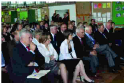
Uczestnicy konferencji w trakcie wystąpień zaproszonych gości

Prawidłowy rozwój dzieci wspierają specjaliści – logopedzi i psycholodzy, a raz w tygodniu odbywają się zajęcia z rytmiki. W pracę ośrodków zaangażowani są rodzice, którzy podczas zajęć pełnią rolę asystentów nauczycieli. Proces edukacji organizowany jest w oparciu o kontrakt z dziećmi. Nauczycielki prowadzą zajęcia metodą projektów badawczych w taki sposób, by rozwijać u dzieci ciekawość, pewność siebie, umiejętności społeczne, kreatywność, wytrwałość w wykonywaniu zadań.