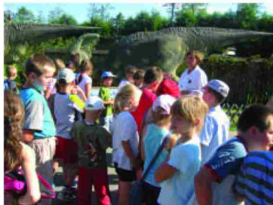
W trakcie wycieczki do Bałtowa

Czas płynął nie tylko na tańcach ale i śpiewie, dzieci próbowały swoich sił w konkursie piosenki indywidualnej i zespołowej. Oprócz zajęć ruchowych były również zajęcia artystyczne: malowanie, lepienie z plasteliny, składanie origami. Zadbaliśmy również o rozwój intelektualny, odbył się cykl zajęć profilaktycznych dotyczących zdrowego stylu życia. Wyróżniających się i uzdolnionych kolonistów wyróżniliśmy nagrodami.