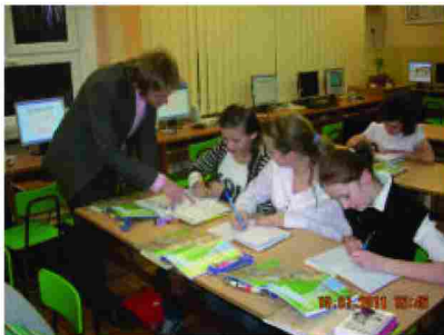
Zajęcia z języka niemieckiego