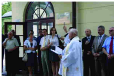
Uroczyste poświęcenie oddanej inwestycji