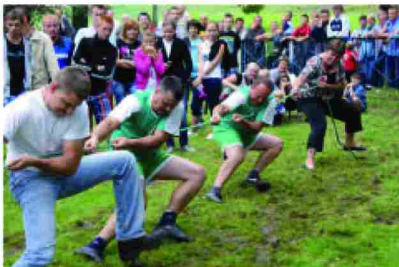
Najbardziej dopingowana przez kibiców konkurencja - przeciąganie liny. Na zdjęciu drużyna z Roźniatowa

Uczniowskich Klubów Sportowych, nauczyciele wychowania fizycznego ze szkół z terenu naszej gminy