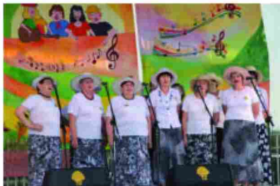
Występ zespołu z Maćkówki

Spotkaniom towarzyszyły turnieje biesiadne, stoiska z regionalnym jadem i rekwizytem artystycznym.