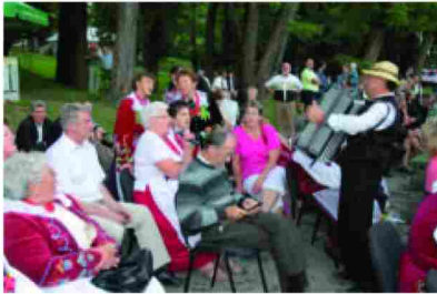
Wspólne śpiewanie uczestników przeglądu

Zespoły z naszej gminy otrzymały następujące nagrody: w kategorii: dorośli Zespół Śpiewaczy z Kisielowa - II miejsce, a Zespół Śpiewaczy z Roźniatowa wyróżnienie II stopnia. Natomiast w kategorii: dzieci i młodzież: II miejsce otrzymał Młodzieżowy Zespół Śpiewaczy z Łapajówki, a III miejsce Młodzieżowy Zespół Śpiewaczy przy Szkole Podstawowej w Zarzeczcu.