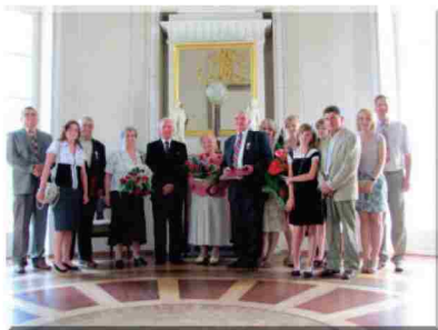
Pamiętkowe zdjęcie w zarzeckim pałacu

W swoim imieniu Wójt przekazał okolicznościowe dyplomy i wiązanki kwiatów. W tej pięknej chwili towarzyszyła Jubilatom rodzina. Lampka szampana, życzenia oraz okolicznościowy tort sprawiły, że dostojni goście ocierali łzy wzruszenia.