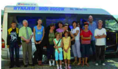
Pamiątkowe zdjęcie uczestników szkolenia

W lipcu 2011 r. 7 osób biorących udział w projekcie uczestniczyło w zorganizowanym wyjeździe do Ośrodka szkoleniowego w Cisnej, gdzie zorganizowane były zajęcia dotyczące treningu umiejętności i kompetencji społecznych, jak również szkolenie z zakresu doradztwa zawodowego. Osoby przebywały tam razem ze swoimi dziećmi, które miały zapewnioną opiekę.