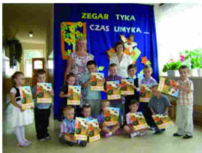
Oddział POP w Roźniatowie

W dniu 1 sierpnia 2011 roku odbyła się rekrutacja dzieci na nowy rok szkolny 2011/2012, w wyniku której rekrutowanych zostało 43 nowych dzieci. Z dniem 1 września 2011 roku do ośrodków przedszkolnych uczęszczać będzie 175 dzieci.