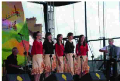
Występ zespołu z Łapajówki

Jury miało nie lada orzech do zgryzienia, ponieważ wszystkie zespoły śpiewały i prezentowały się wspaniale. Po ogłoszeniu werdyktu zapanowała radość wśród naszych uczestników, gdyż I miejsce oraz nagrodę pieniężną zdobył Zespół Biesiadny z Roźniatowa, a III miejsce oraz nagrodę pieniężną zdobył Zespół Biesiadny z Maćkówki. Wyróżnienie oraz nagrodę pieniężną zdobył Zespół Biesiadny z Kisielowa.