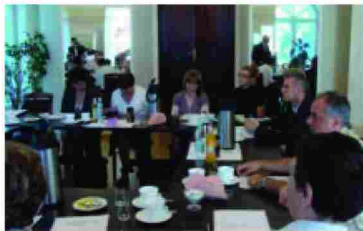
Pierwsze posiedzenie zespołu interdyscyplinarnego

wobec rodzin, w których dochodzi do przemocy oraz efektów tych działań.