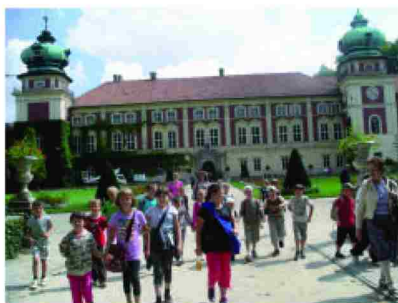
W trakcie zwiedzania Łańcucia

tatarskiego". Przyrodę z różnych zakątków świata oraz wystawę muszli i ptaków obejrzelśmy w Arboretum w Bolestraszcach. W XVI wiecznym zamku Lubomirskich w Łańcucie obejrzelśmy arystokratyczne wnętrza i powozownię. W Skansenie w Markowej wróciliśmy do czasów naszych pradziadków. Złożyliśmy hołd wianką kwiatów bohaterskiej Rodzinie Ulmów.