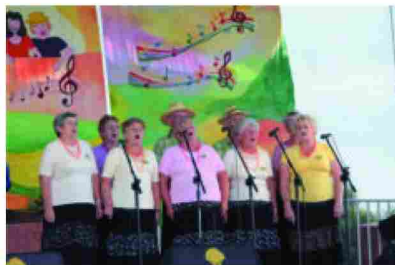
Występ zespołu z Roźniatowa zdobywcy I miejsca