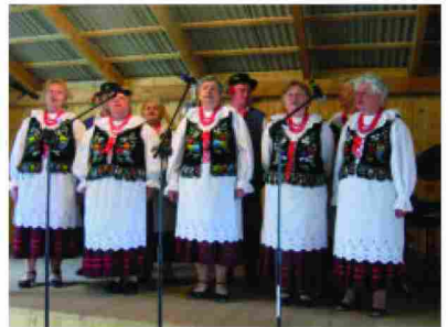
Występ Zespołu Śpiewaczego z Roźniatowa

w Zarzeczcu. Wesoła i miła atmosfera oraz piękna „bitwa na głosy” udzieliła się odbiorcom, którzy w rytm utworów granych przez Zespół z Łapajówki tańczyli oberki, polki i walczyki.