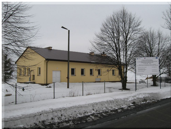
Odnowiona stacja uzdatniania wody w Zarzeczcu

Planowany termin zakończenia i oddania inwestycji do użytku to 30 maja 2010 r.