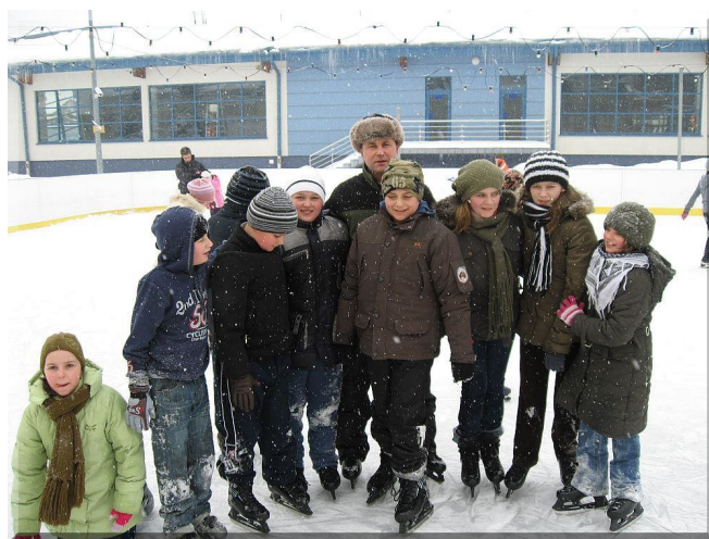
Wspólne zdjęcie z jarosławskiego lodowiska

Największą jednak popularnością cieszyły się zajęcia zorganizowane na basenie i lodowisku MOSiR w Jarosławiu, gdzie w nowoczesnym obiekcie rekreacyjno-sportowym uczniowie mogli doskonalić jazdę na łyżwach, a następnie korzystać z atrakcji dostępnych w krytym basenie kąpielowym.