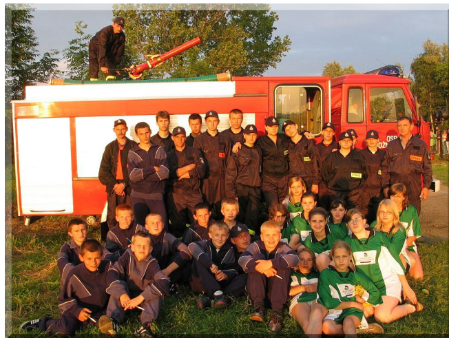
Drużyna OSP Roźniatów

Baza techniczna: remiza, samochód GBAM-2,5/16/8, 2 motopompy oraz wyposażenie z umundurowaniem.