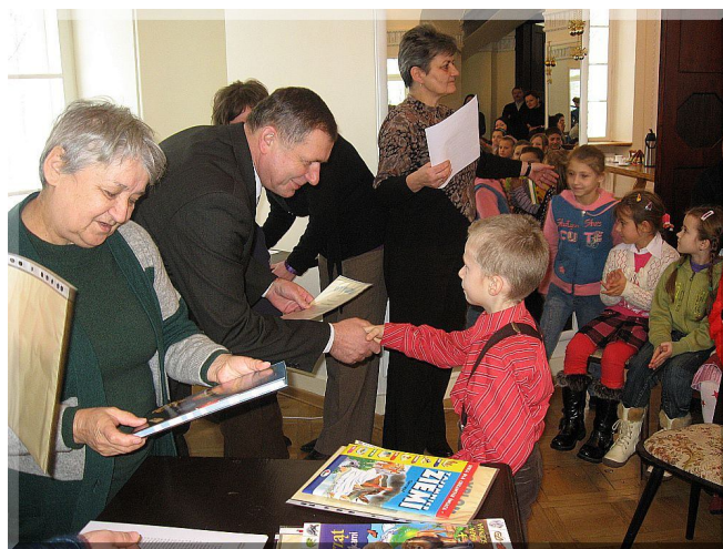
Wręczenie nagród uczestnikom konkursu