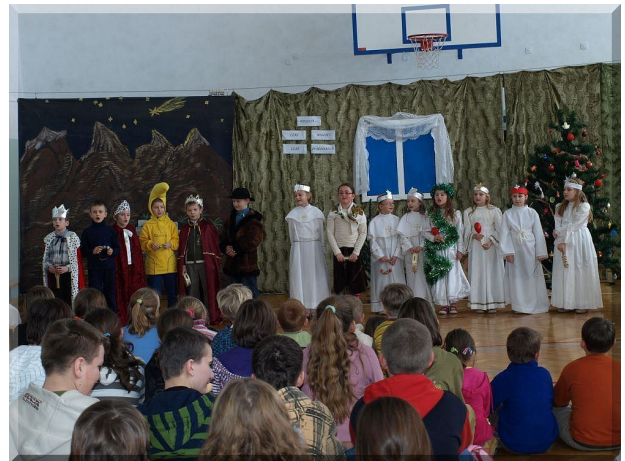
Występ dzieci z Żurawiczek

edukacyjne w postaci Ośrodków Zainteresowań, w których to dzieci mogły realizować działania edukacyjne zaplanowane przez nauczyciela, zgodnie ze swoimi możliwościami, zdolnościami i talentami. Pojawiła się nie tylko możliwość indywidualizacji nauczania, ale także manifestacji własnych potrzeb i ujawniania posiadanych przez dzieci talentów.