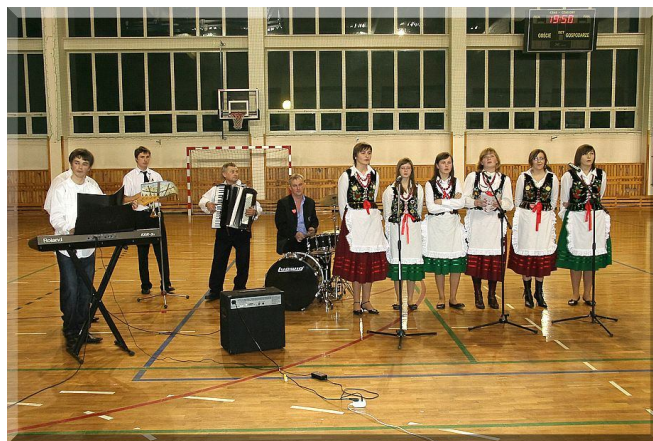
Występ zespołu z Łapajówki