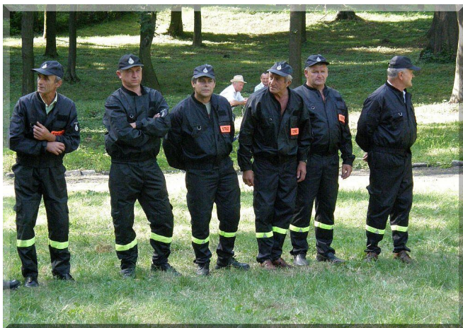
Zawody weteranów – Zarzecze 2008

Jednostka zajmowała czołowe miejsca w zawodach sportowo-pożarniczych na szczeblu gminnym, powiatowym i wojewódzkim. Formy pracy społeczno-kulturalnej to organizowanie zabaw, festynów, zbieranie darów dla poszkodowanych, adoracja Grobu Pańskiego, praca społeczna na rzecz społeczności lokalnej, aktywna współpraca z KGW.