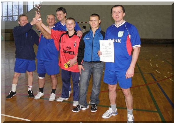
Pamiątkowe zdjęcie z turnieju