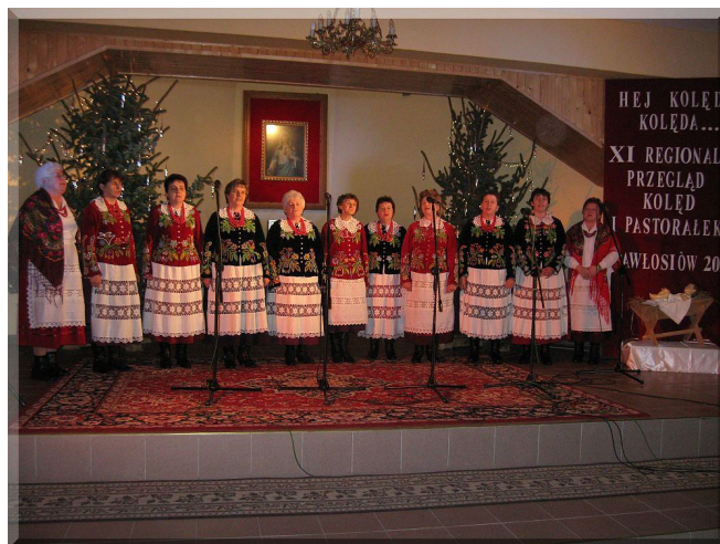
Występ zespołu z Kisielowa