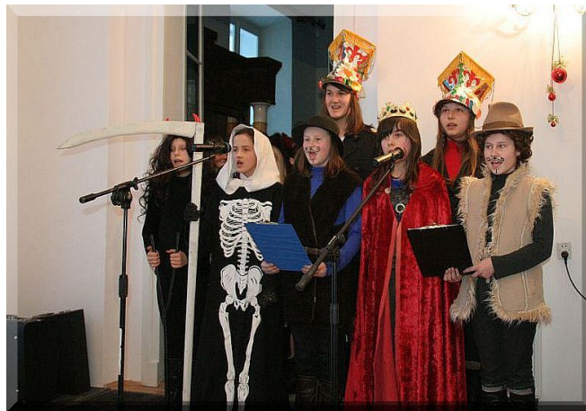
Występ zespołu „Orlenki” z Pełnatecz

W przeglądzie uczestniczyło 98 osób ze wszystkich szkół podstawowych, gimnazjum i szkoły średniej z terenu naszej gminy.