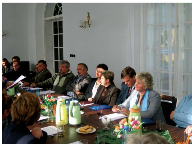
Uczestnicy spotkania w Zabytkowym Pałacu w Zarzeczcu

w zakresie wykorzystania środków Unii Europejskiej w nowym okresie programowania.