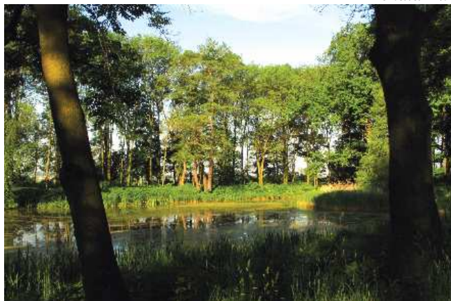
Park w Zarzeczcu