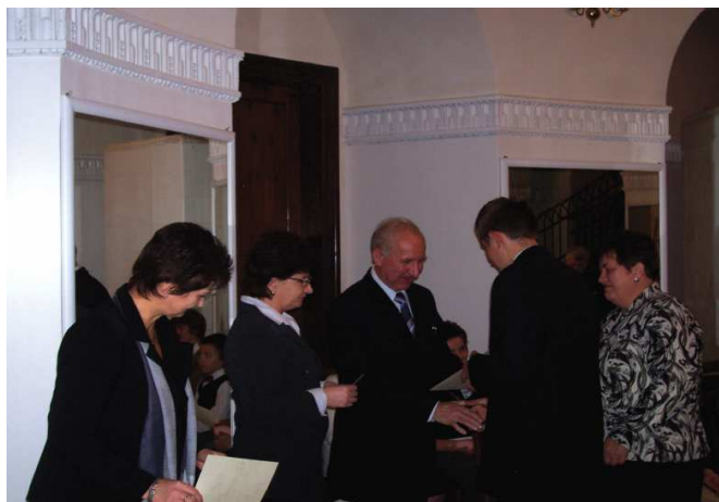
Wręczenie stypendiów w Zabytkowym Pałacu w Zarzeczcu

Kolejny raz 14.10.2007r. w Zabytkowym Pałacu w Zarzeczcu odbyła się uroczystość wręczenia stypendiów naukowych przyznanych przez Stowarzyszenie Rozwoju Gminy Zarzeczce. Stowarzyszenie działa na terenie Gminy Zarzeczce od 2003r. Jest organizacją pożytku publicznego i prowadzi lokalny fundusz stypendialny. Gromadzi środki przez prowadzenie i organizację imprez charytatywnych, zbiórkę 1% podatku od osób fizycznych oraz zabiega o darowizny od sponsorów. W roku 2007 najhojniejszymi darczyńcami okazali się: