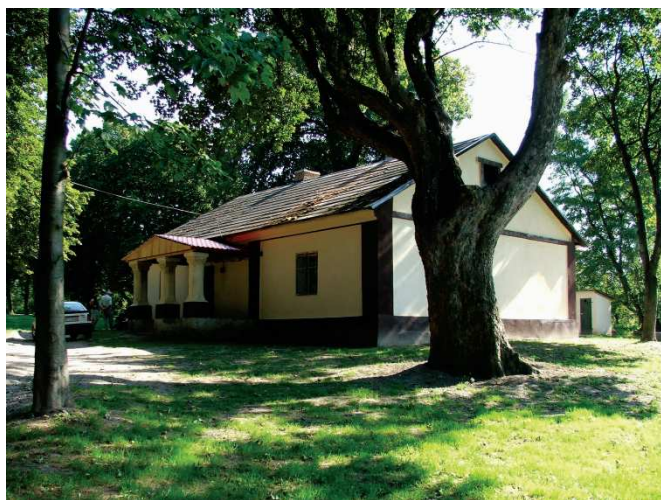
Oficyna w Siennowie

W miesiącu styczniu przyszłego roku zostanie złożony wniosek o dofinansowanie zadania pod nazwą „Rewitalizacja zasobów przyrodniczo-kulturowych w zabytkowym parku w Siennowie” w ramach działania 3.3 „Odnowa i rozwój wsi” Programu Rozwoju Obszarów Wiejskich na lata 2007-2013. Maksymalna dotacja na realizację zadania wynosi 500 tys. zł., przy czym poziom pomocy wynosi do 75% kosztów.