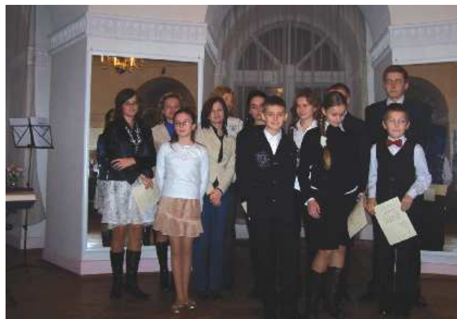
Stypendyści roku szkolnego 2007/2008

Stypendia po 100 zł miesięczne za I półrocze roku szkolnego 2007/2008, otrzymali następujący uczniowie: