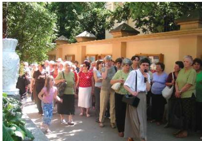
Pielgrzymka do Lichenia

Zorganizowane zostały trzy pielgrzymki: do Leżajska, Dukli oraz do Lichenia. Ta ostatnia cieszyła się wielkim zainteresowaniem, ponieważ oprócz uroczego Lichenia zwiedzili Częstochowę oraz Niepokalanów. Wszyscy wrócili zadowoleni i już planują następny wyjazd do Łagiewnik, Wadowic oraz Zakopanego.