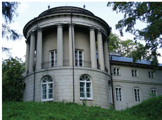
Zabytkowy Pałac w Zarzeczcu

W miesiącu listopadzie został złożony wniosek o dotację do Ministra Kultury na modernizację instalacji centralnego ogrzewania w Sali Okrągłej i Sali Weneckiej na kwotę 35 tys. zł. W salach zamontowano nowoczesne grzejniki (w piecu, kominkach i pod podłogą). Wszystkie prace są prowadzone pod ścisłym nadzorem Wojewódzkiego Konserwatora Zabytków.